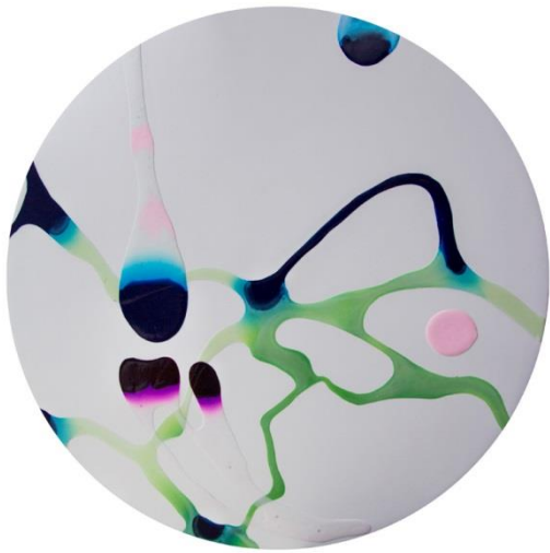
垂れる 2014 300φ acrylic on panel