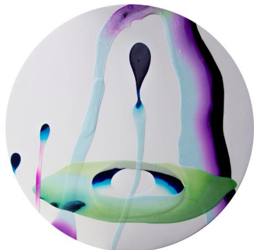
輪の中から 2014 300φ acrylic on panel